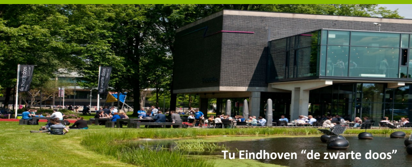
Tu Eindhoven "de zwarte doos"